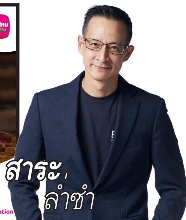
สาระ ลำช้า

และร้าน Sushiganbattehatyai อาหารญี่ปุ่นร้านเดียวในหาดใหญ่ที่มีเชฟเป็นเจ้าของและมีประสบการณ์ด้านอาหารญี่ปุ่นจากต่างประเทศ สมาชิกฯ สามารถแลกคะแนนสะสม Smile Points ได้ตั้งแต่วันที่ - 31 ก.ค. 2563